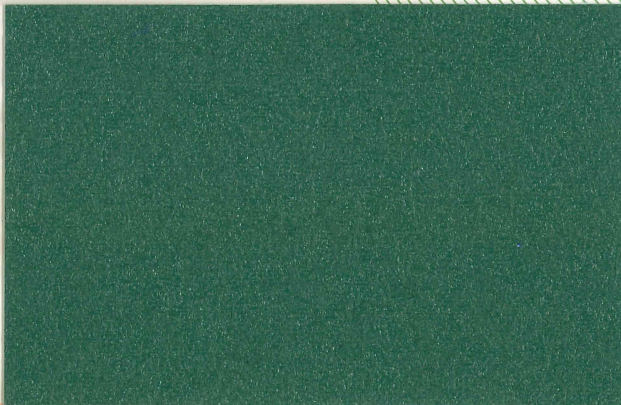
トレダック® 450L G (グリーン)